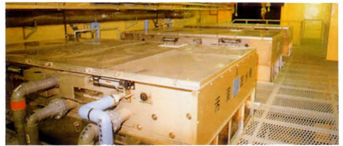
▲脱水機（ハイドプレス）