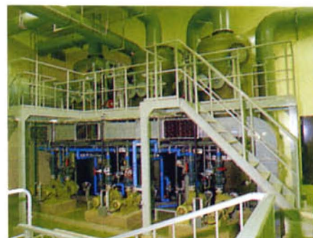
▲中濃度薬液脱臭塔