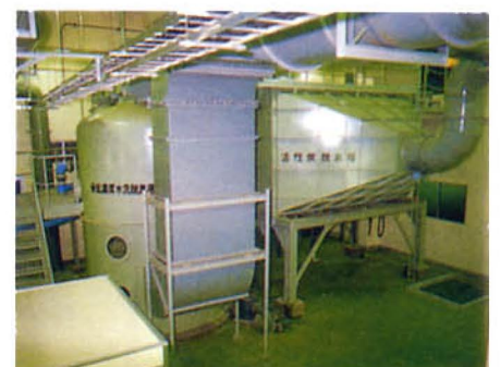
▲極低濃度水洗脱臭塔・活性炭脱臭塔