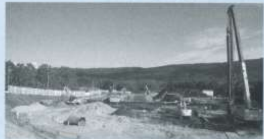
工場棟解体後のRDFセンター跡地