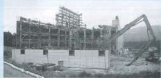
工場棟解体工事の様子

小山町桑木地先のごみ固形燃料化施設、御殿場・小山RDFセンターの解体工事が今年度完了します。今後、跡地は小山町の施策のもと「ふじのくにフロンティア推進区域」として利用されます。