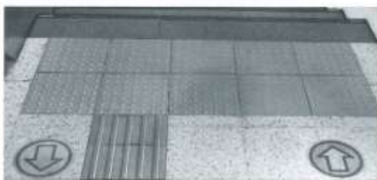
焼却センターから排出される焼却灰は、資源化され雑草抑制資材や点字ブロック等として再利用されています。