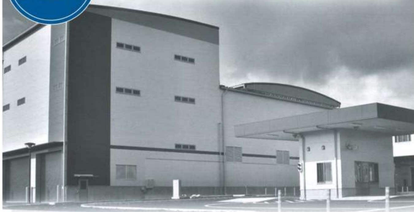
再資源化センター 計量棟(手前)工場棟(奥)