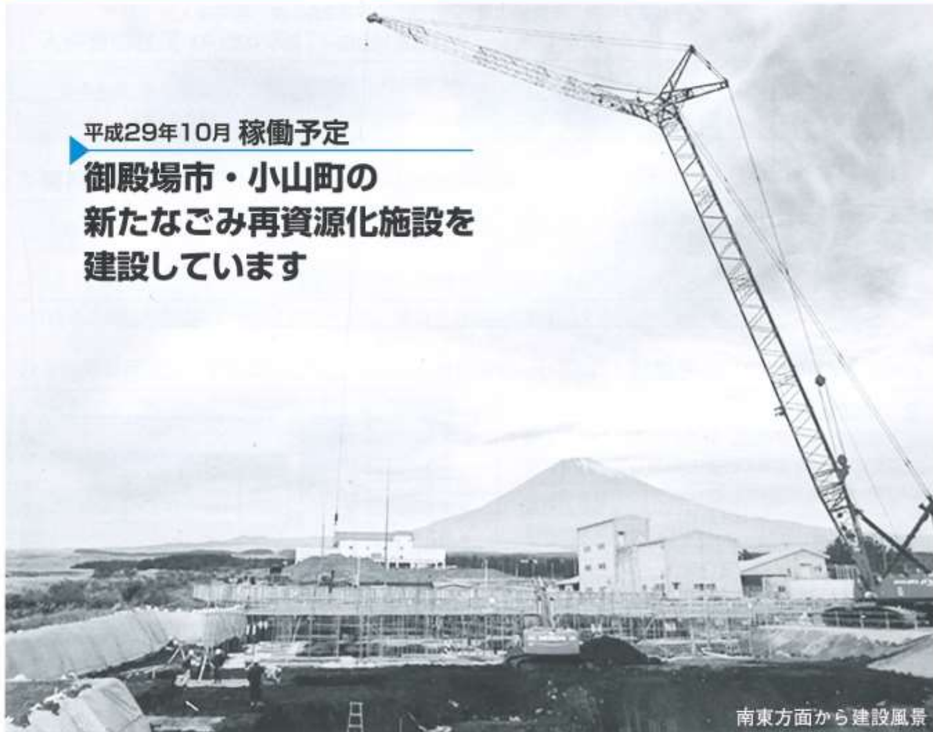
南東方面から建設風景