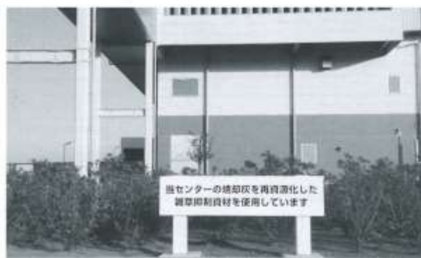
焼却センターでは、焼却灰を資源化した雑草抑制資材を利用しています。