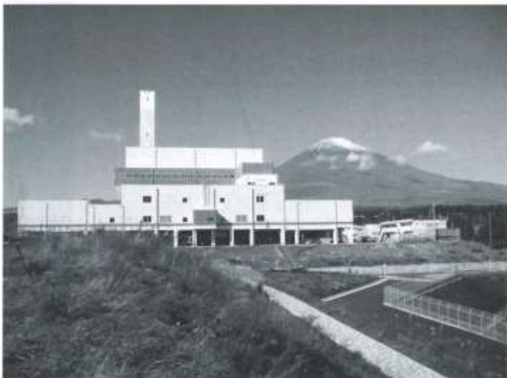
▲東から見た焼却センター

広域行政組合では、御殿場小山RDFセンター(小山町桑木地先)にかわる新たなごみ焼却施設建設を御殿場市板妻及び神場地先に進めています。現在は、本稼働に向けての試験運転を実施しています。