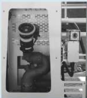
放水銃・リモートカメラ (左から)

操縦員がカメラを操作し、上空より災害状況の把握及び自動放水銃による無人放水ができます。(手元のPCで映像が確認できます)